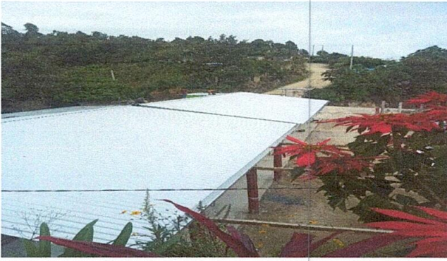
Foto1: Sustitución de lámina.